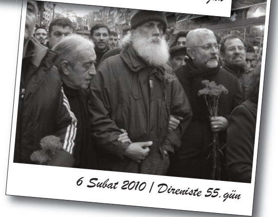
6 Şubat 2010 | Direnişte 55. gün