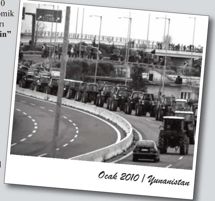
Ocak 2010 | Yunanistan

Yunanistan'daki bütçe açığı ile ekonomik kriz üyesi olduğu AB'yi de etkiliyor. Uzmanlar, önlem alınmaması durumunda Yunanistan'daki gelişmelerin Euro para birimi için ciddi sonuçlara yol açabileceğini söylüyor.